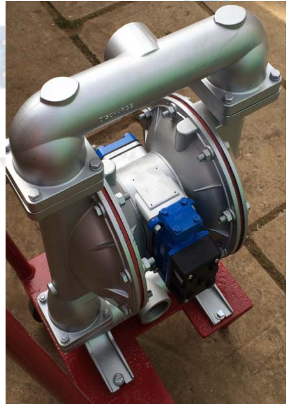
Reparación bomba acero inoxidable 2", incluye pintura estética de bomba y carro.