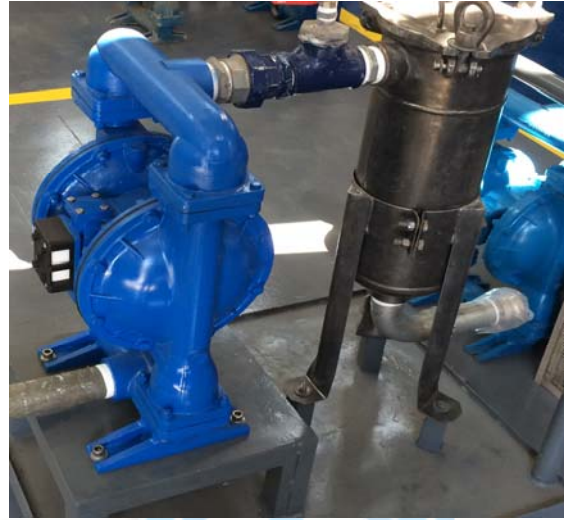
Mantenión bomba para filtro.