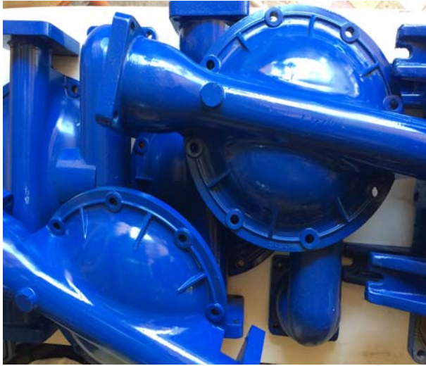
Limpeza, pintura de manifolds y cámaras.